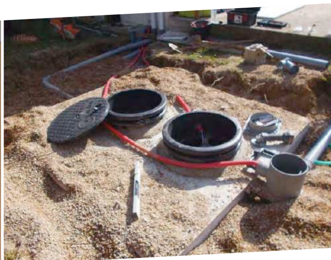
Contrôle de conception et contrôle des travaux pour une réhabilitation d'un dispositif d'assainissement non collectif