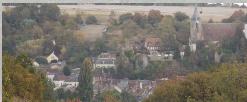
Cône de vue sur le cœur historique de Château-Renard