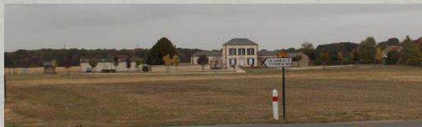
Vue dégagée d'un plateau à Chuelles